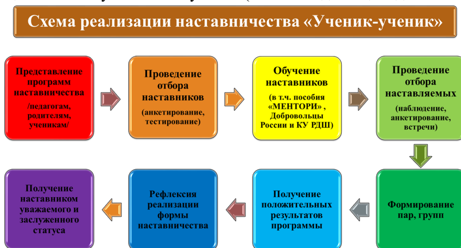
Рис.1. Описание схемы реализации наставничества «ученик-ученик»

Целью взаимодействия наставника и наставляемого является разносторонняя поддержка обучающегося с особыми образовательными/социальными потребностями либо временная помощь в адаптации к новым условиям обучения (включая адаптацию детей с ОВЗ).